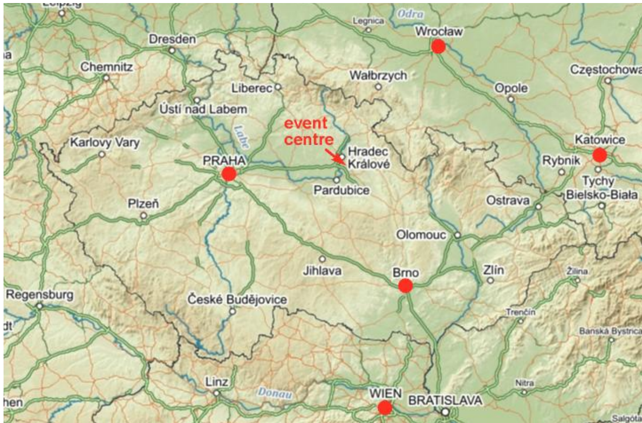
Mapa regionu, umístění letišť a centra závodu

ČESKÝ POHÁR, WRE, INOV-8 CUP – ŽEBŘÍČEK A KRÁTKÁ TRÁŤ / MIDDLE · KLASICKÁ TRÁŤ / LONG HODĚŠOVICE, KOLIBA · 9. – 10. 9. 2023